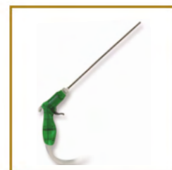
LANDANGER - E212401 KIT DE LAVAGE ASPIRATION REVOLVER DOUBLE PERCUTEUR