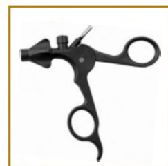
COMEPA - CPR303 / CPR304 / CPR305 POIGNEE REUTILISABLE POUR INSERT A USAGE UNIQUE