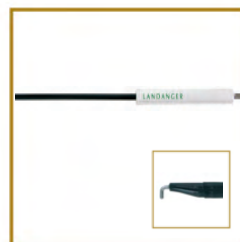
LANDANGER - E252013 CROCHET DE COAGULATION MONOPOLAIRE EN "L"