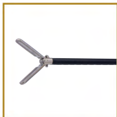
KANGJI - KJ108Y.467 INSERT JOHAN GRASPER