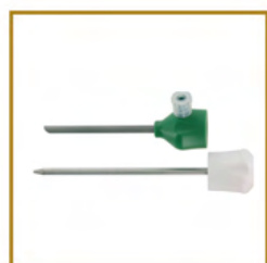
LANDANGER - E220031 TROCART A DILATATION