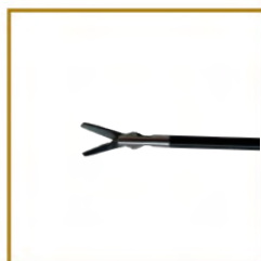
COMEPA - CI303803 INSERT CISEAUX COURBES