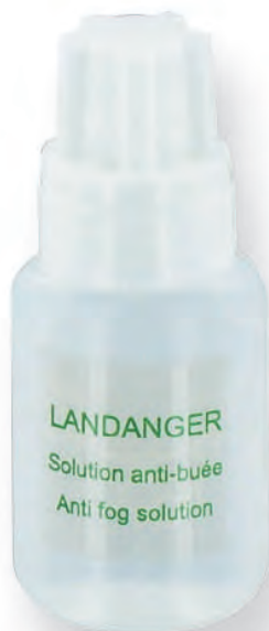
Bouteille transparente See-through bottle