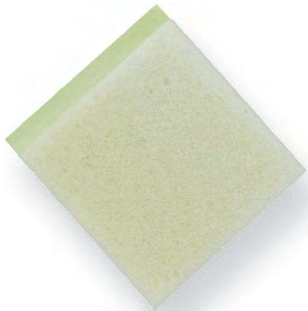
Éponge autocollante Self-adhesive sponge